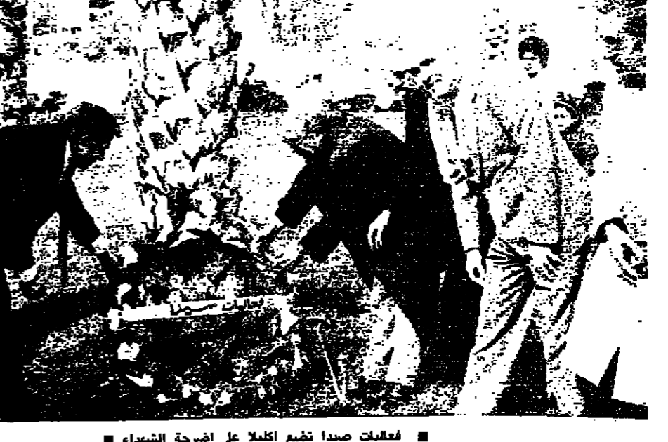
فعاليات صيدا تشع اكلابا على اشرطة الشهداء